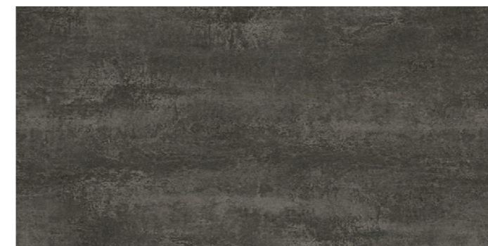
STONE MARQUINA 30,5 x 61 cm - 12" x 24" 46 x 92 cm - 18.1" x 36.2"