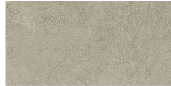
STONE GRUNGE 30,5 x 61 cm - 12" x 24" 46 x 92 cm - 18.1" x 36.2"