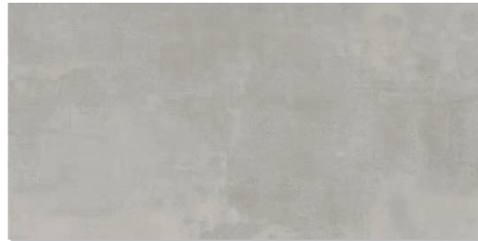
STONE GRAFITO 30,5 x 61 cm - 12" x 24" 46 x 92 cm - 18.1" x 36.2"